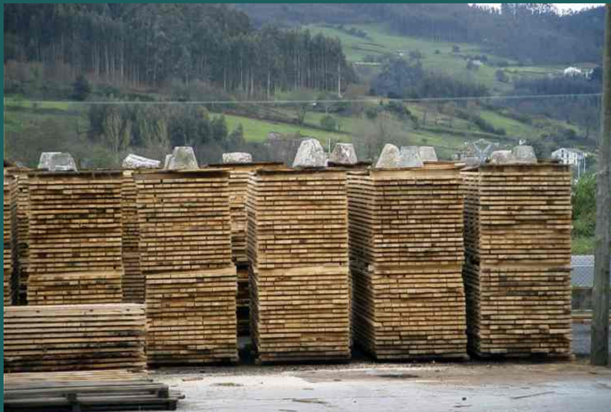
OREO DE LA MADERA