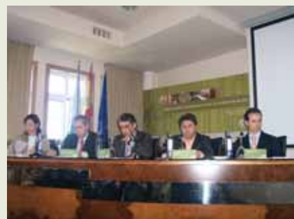
Asemblea Xeral Ordinaria 2006 Páx. 4