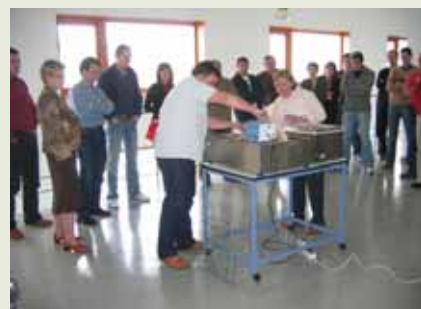
Cursos CMA CIS-MADEIRA Páx. 5