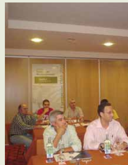
Formación CMA 2006 Páx. 10