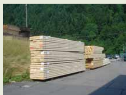
Misión Comercial a Alemaña Páx. 8