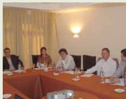
Almorzo de traballo “Estratexia para optimizar a súa relación comercial con China” Páx. 7