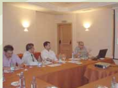
Proxecto PRM Páx. 9