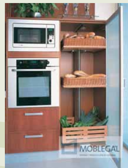
Rincón do Asociado: Moblegal Páx. 13-15