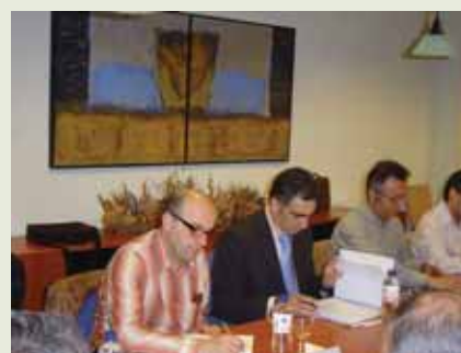
Creación da Mesa da Madeira Páx. 6