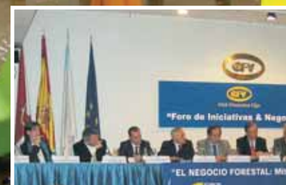
Foro: O Negocio Forestal ■ Páx. 9