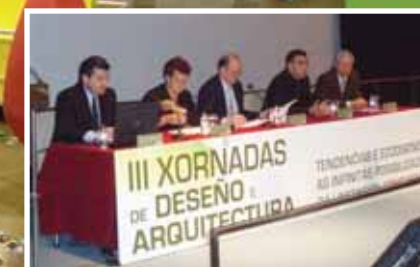
III XORNADAS de Deseño e Arquitectura ■ Páx. 10-11