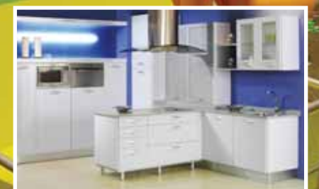
Rincón do Asociado: Carballo Cocinas ■ Páxs. 13-15